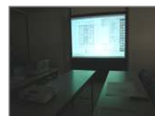
▲大きなスクリーンに表示したいときは、紙だけで記入